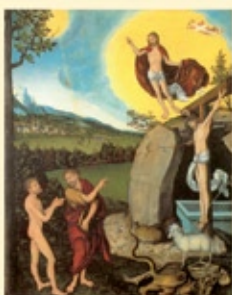
Kristus-vaiheita matkalla henkiseen ihmiseen