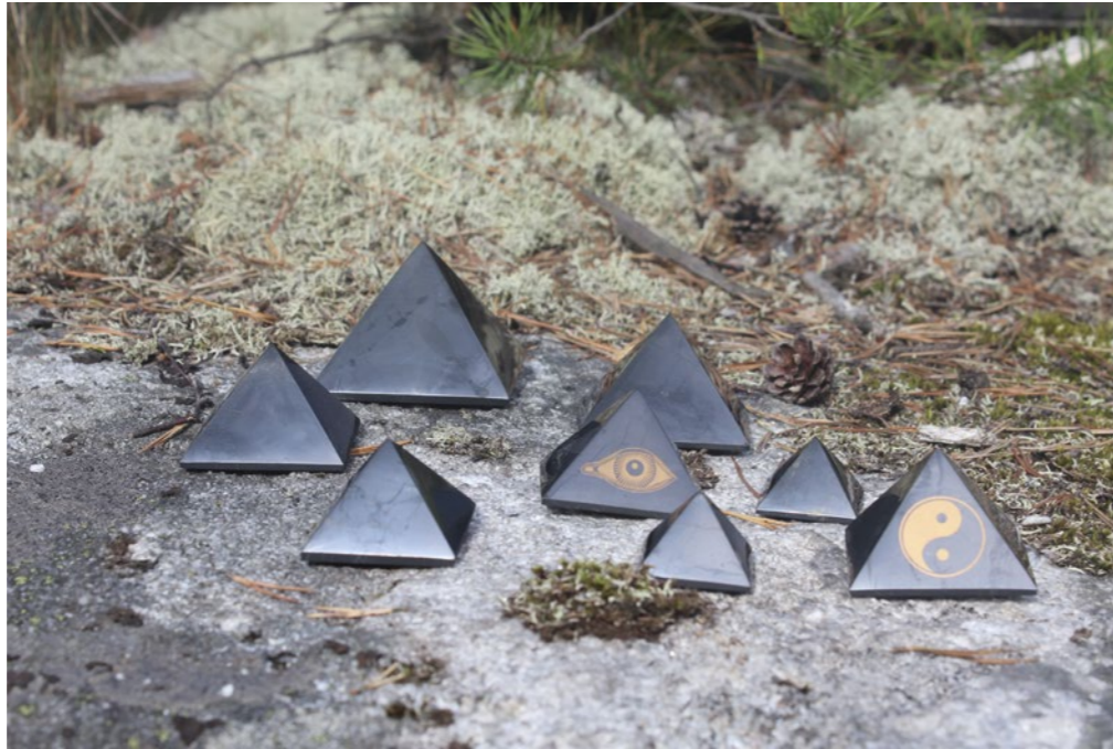
Sungiittipyramidien mittasuhteet ovat samat kuin Egyptin pyramideissa. Jopa 10 cm korkean pyramidin vaikutusalue ulottuu vähintään viiteen metriin. Pyramidit vahvistavat elimistön bioenergiaa ja elinvoimaa, suojaavat haitallisilta elektromagneettisilta säteilyiltä ja maasäteilyltä sekä puhdistavat juomaveden. Suositellaan esim. tietokoneen viereen tai yöpöydälle.

Sungiitti toimii fyysisellä, emotionaalisisella, mentaalisisella ja henkisellä tasolla. Sen ominaisuuksista on olemassa lukuisia kirjattuja dokumentteja Venäjällä, jossa kiven käytöllä on pitkät perinteet. Sungiitin tiedetään parantavan, puhdistavan, suojaavan, neutralisoivan, uudistavan ja maadoittavan. Se nostaa ympäristönsä värähtelytasoa ja tukee kasvua kaikissa elä-