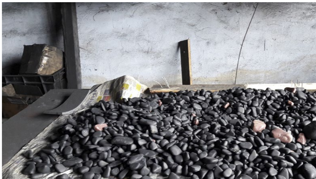
Yhdessä veden molekyylin kanssa sungiitin fullereenit ovat ainutlaatuisia antioksidantteja. Sungiittivesi poistaa mm. bakteereita ja muita mikrobeja, nitraatteja, raskasmetalleja, tuholaismyrkkyjä, kemikaaleja ja klooria sekä tasapainottaa ja puhdistaa hellävaraisesti kehoa.

ta", joissa ihmisiä hoidetaan sungiittiterapioilla. Pariisistakin löytyy sungiittihuone ja nyt myös Porvoossa Energiahoitola Quantiassa on hoitava ja kehon energioita tasapainottava sungiittinurkkaus, jonne voi varata ajan rentouttavaan hoitoon. Samalla on mahdollista ostaa erilaisia hoitavia ja suojaavia sungiitteja itselleen. Niitä voi tilata myös Quantian verkkokauppa Fakiran kautta. Katso lisää www.quantia-energia.fi .