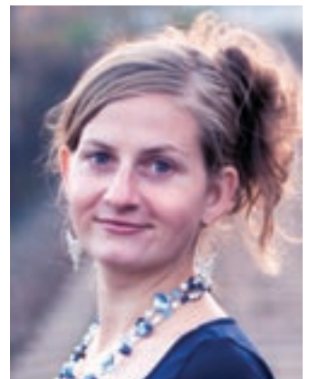
Mitran musiikkia voi kuulla osoitteessa: www.mikseri.net/mitra