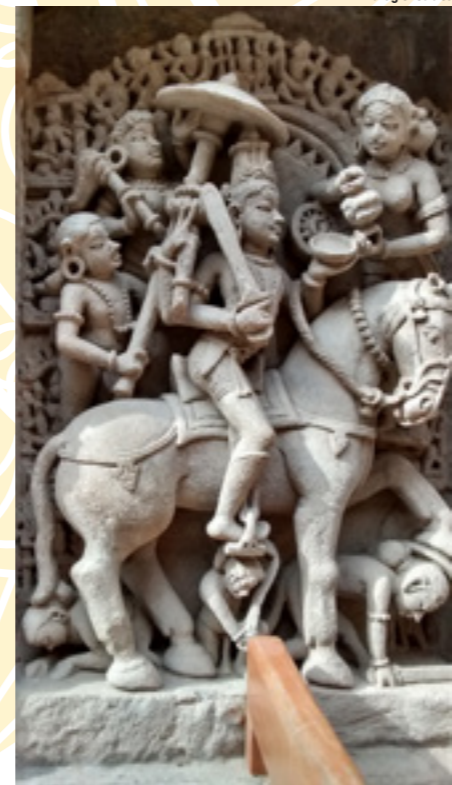
Kalki-avatara hevosensa selässä. Hän on yksi Veedoissa kuvailuista Jumalan inkarnaatioista, ja yleensä Hän ilmestyy Kalin aikakauden lopussa.

Näin opetti paramahamsa bhakti-yogi Sri Sukadeva kuningas Pariksitia. Nämä säkeet antoivat jo tuhansia vuosia aiemmin ihmiskunnalle varoituksen siitä, minkä nähtiin olevan tulossa – ja nyt ne antavat nykyihmiselle väläyksen globaali-